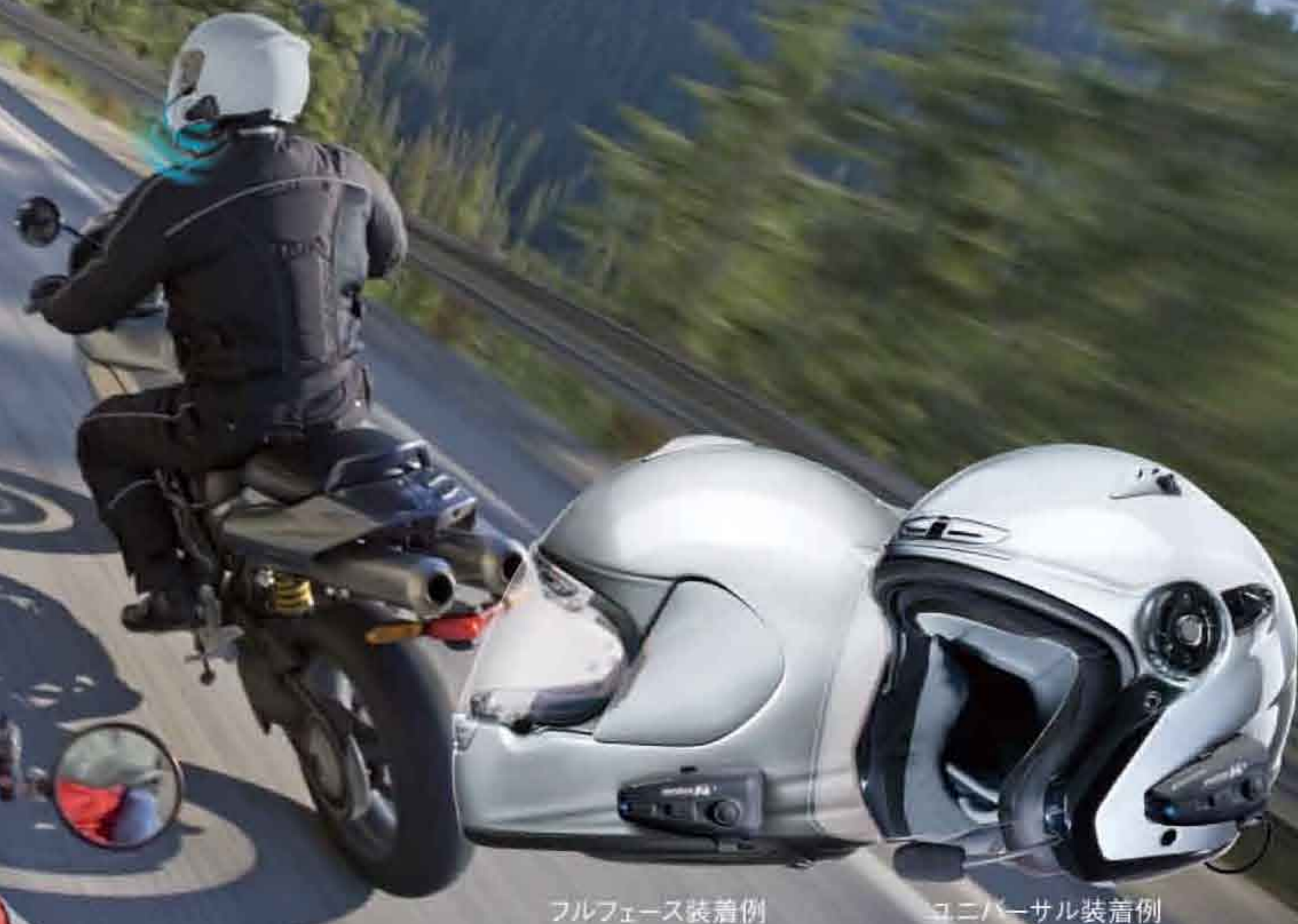
フルフェイス装着例